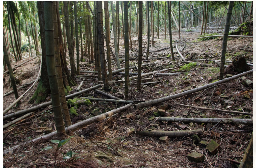
新道野煉瓦工場跡