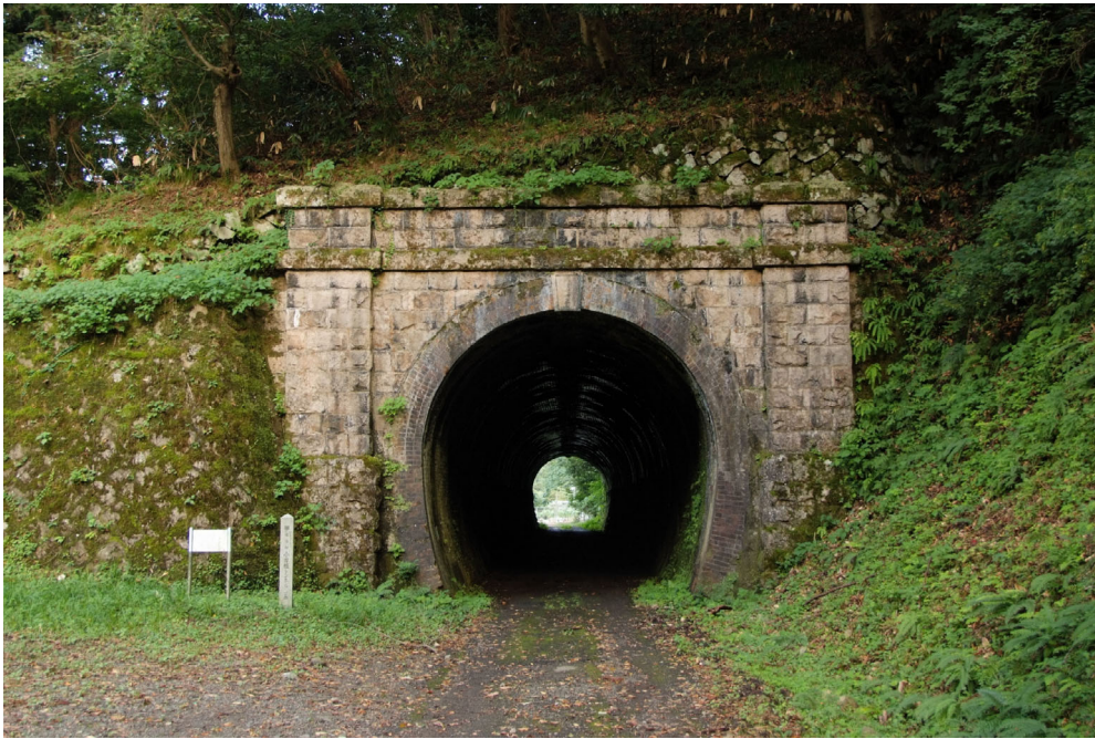
敦賀線小刀根トンネル