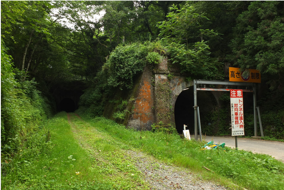
北陸本線中山トンネル