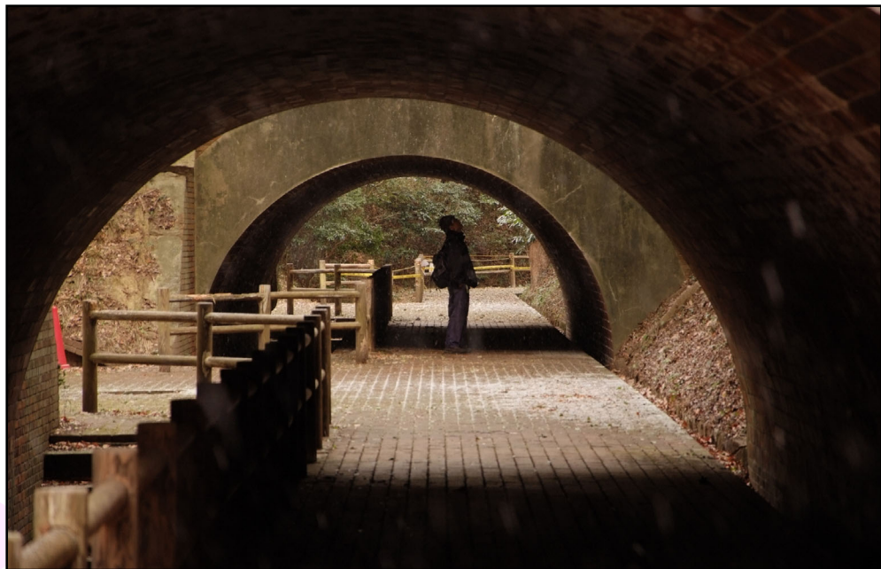
深山第1砲台 砲座通路

[n] 友ヶ島砲台の遺構は近代築城研究会の皆さんが一生懸命調査して報告書も出されているけれども、公的には何にもされてないといっている。『和歌山県の近代化遺産』では軍事遺構として採集されてるけれどもね。どんな遺構があり、どんな状態にあるのか、それに価値があるのかどうか、学術的な調査・評価のないままイベントに間に合わせるため工事が進められている。遺