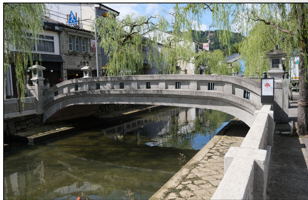
城崎温泉橋梁群のひとつ・柳湯橋