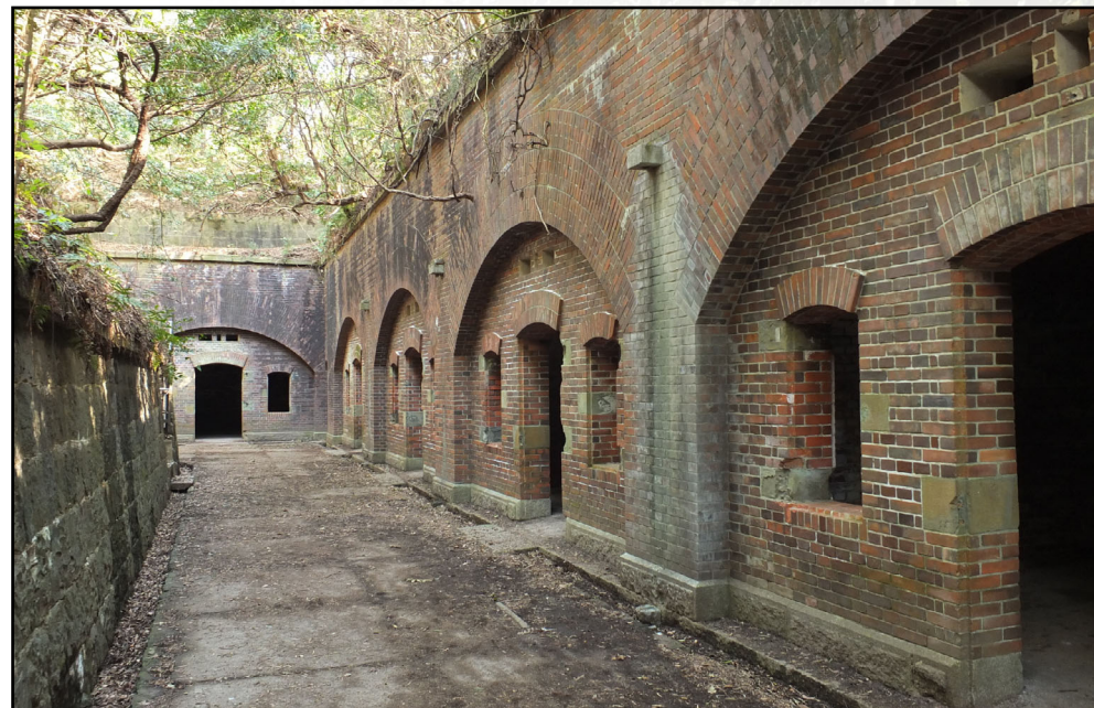
友ヶ島第3砲台 五連砲側庫

構が破壊されたりとか、当時はなかった手すりが作られたりとかしてしまうんじゃないかって、先生心配されてます。