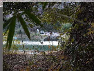
▲旧道志大橋の相模湖側です。先ほどの釣り人も見えます。

山中湖から山伏峠を越え、山伏峠付近を水源とする道志川下流、昭和36年に城山ダム(津久井湖)建設に伴い、新道志大橋がかけられました。旧道志大橋には橋台、橋脚が残っています。今回はその探索写真をお送りします。[増田明彦]