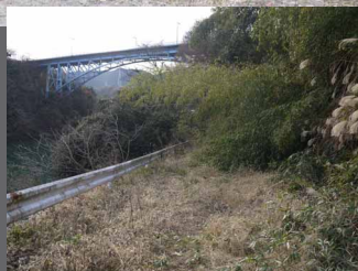
▲新道志大橋と旧道です。