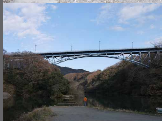
▲新道志大橋とその下にある旧道志大橋の遺構です。釣り人がいました。